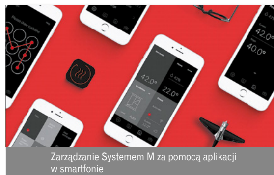
Zarządzanie Systemem M za pomocą aplikacji w smartfonie

wzornictwa i szeroko rozumianego designu, o najwyższym poziomie innowacyjności i jakości projektowej. W procesie nominacji eksperci z Niemieckiej Rady Wzornictwa (German Design Council) zapraszają do udziału w konkursie wyłącznie tych producentów, których urządzenia wyraźnie wyróżniają się na tle konkurencji.