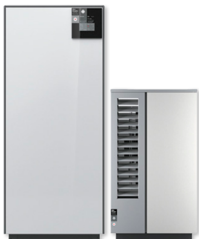
Jednostka wewnętrzna i zewnętrzna

System M zajmuje wyjątkowo mało miejsca, zarówno na zewnątrz, jak i wewnątrz budynku, a jednostkę wewnętrzną można zamontować praktycznie w każdym miejscu, gdyż nie są wymagane minimalne odstępy od ściany. Można ją np. ustawić obok lodówki, pralki