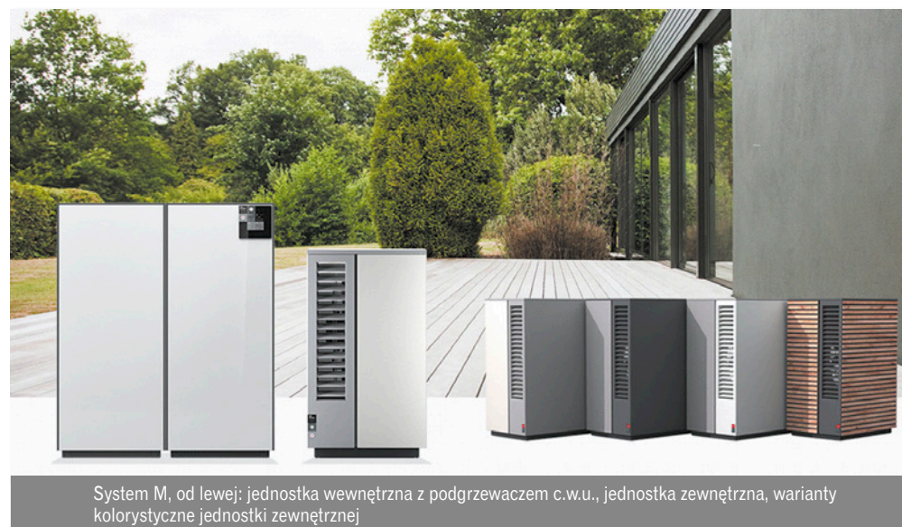
System M, od lewej: jednostka wewnętrzna z podgrzewaczem c.w.u., jednostka zewnętrzna, warianty kolorystyczne jednostki zewnętrznej

szybsze i łatwiejsze niż w jakimkolwiek innym systemie grzewczym. System M zadaje tylko kilka prostych pytań i urządzenie jest od razu uruchamiane. Tę zaletę docenią przede wszystkim instalatorzy. Dzięki dotykowemu wyświetlaczowi na urządzeniu lub aplikacji w smartfonie dostęp do systemu jest zawsze pod ręką. Dotyczy to zarówno odczytu bieżących parametrów, jak i ich zmiany – czy jest to zmiana temperatury w weekend albo podczas wakacji, zmiana mocy wentylacji czy też zdalne włączenie szybkiego nagrzewania. Obsługa Systemu M jest tak prosta, że w przypadku linii urządzeń Pure możliwa jest nawet rezygnacja z wyświetlacza na urządzeniu – wystarczy aplikacja w smartfonie. System jest standardowo dostarczany dla każdej konfiguracji z własnym połączeniem internetowym, może więc sam zgłosić ewentualne nieprawidłowości serwisowi i stale się aktualizować online.