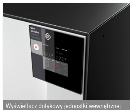
Wyświetlacz dotykowy jednostki wewnętrznej

System M jest wyjątkowo prosty w obsłudze i intuicyjny. Dzięki dopracowanej konfiguracji wstępnej jego pierwsze uruchomienie jest