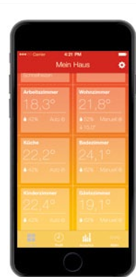
Widok przykładowych pomieszczeń na aplikacji Smart Room Heating