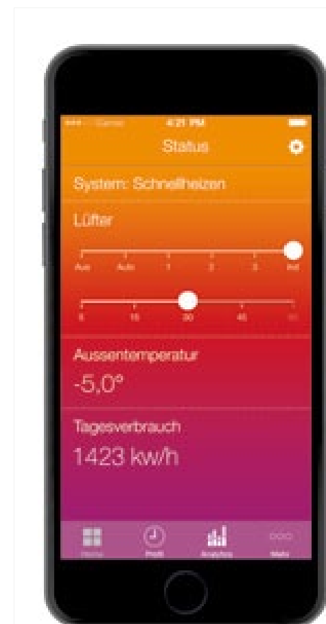
Widok aplikacji Smart Room Heating